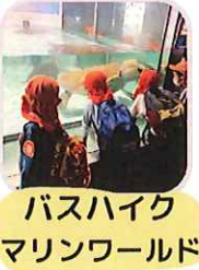
バスハイク マリンワールド

※毎月 お誕生会、身体測定、避難訓練 その他、園児健康診断、歯科検診、尿検査 ※行事予定は中止、変更になる場合があります。